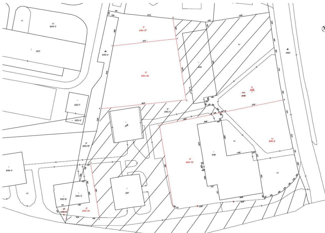
Do vlastníctva mesta Svidník prechádzajú vyšrafované pozemky