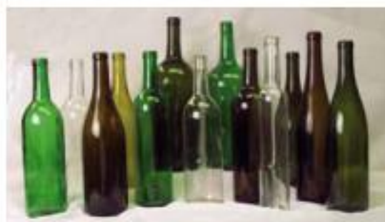
Príklady použitia skla