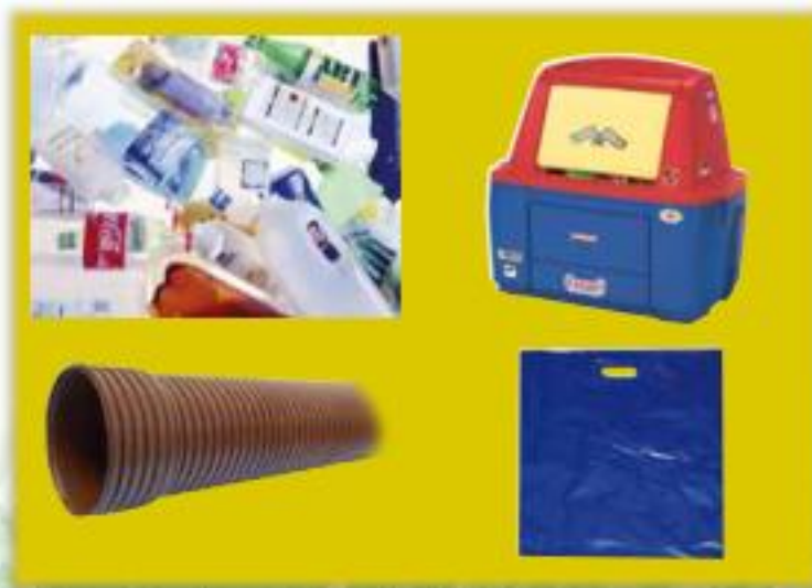
Príklady využitia plastov - fľaše, hračky, ráry, tašky

Dvadsať storočie malo veľa prívlastkov, ako kozmické, atómové, storočie počítačov a elektrotechniky. Vďaka plastom sa označovalo aj ako obdobie plastov.