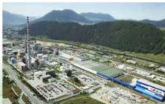
Výroba papiera vMondi SCP