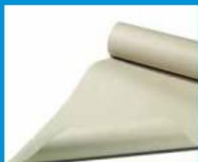
Príklady využitia papiera