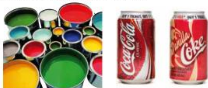
Príklady použitia kovových obalov