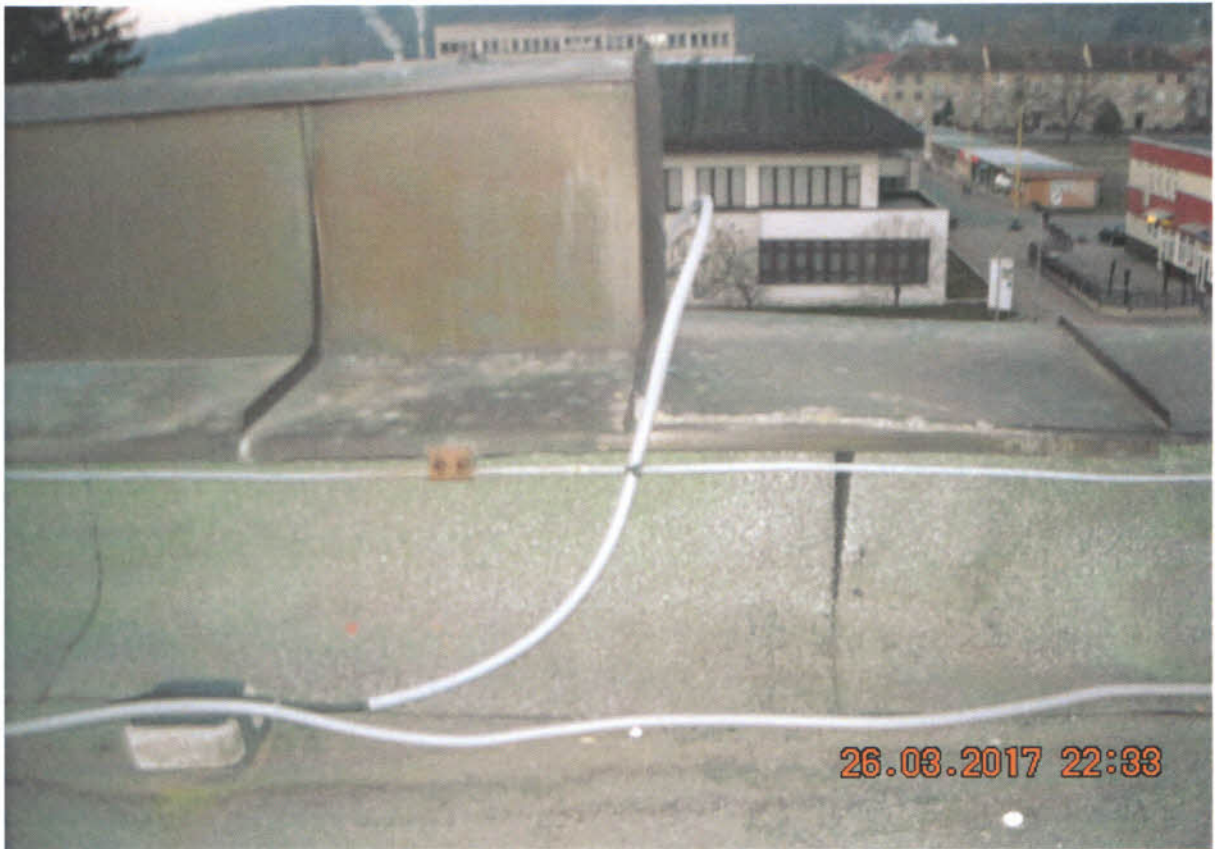
Detail zle prevedenej izolácie na atikovom murive