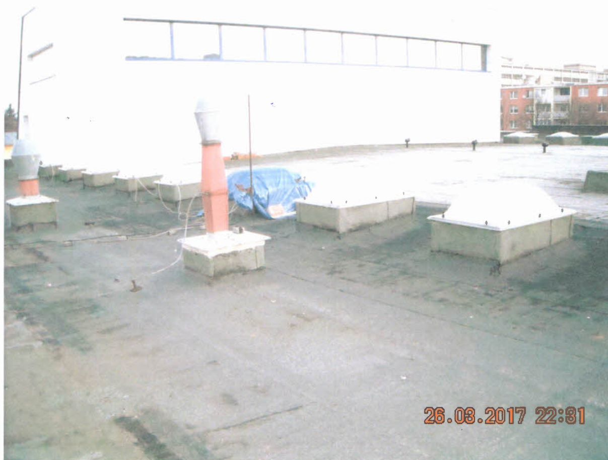
Strecha s poškodenými svetlíkmi