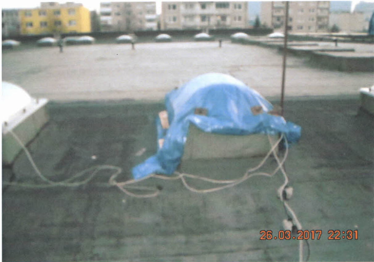
Strešný bodový svetlík – zničený a provizórne prekrytý