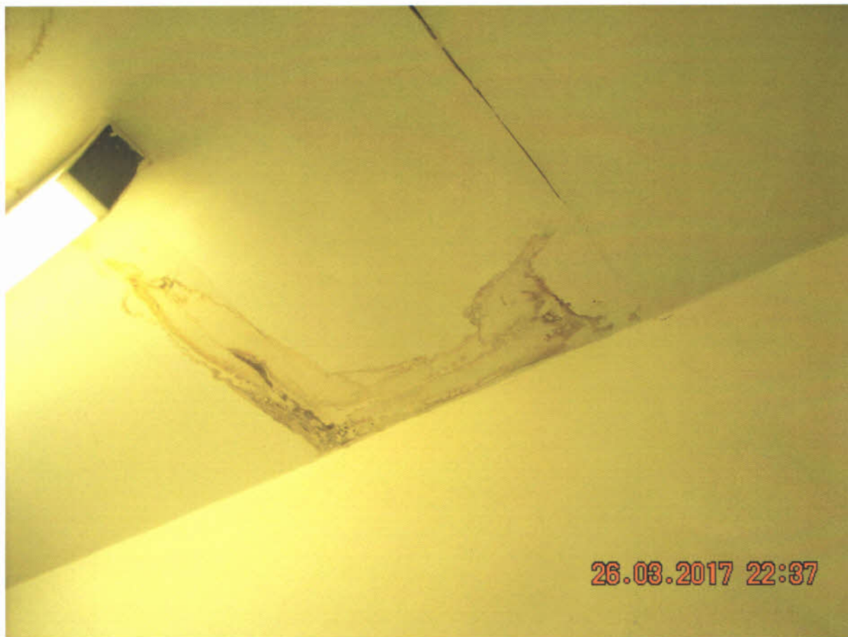
Zatečený podhled na chodbe