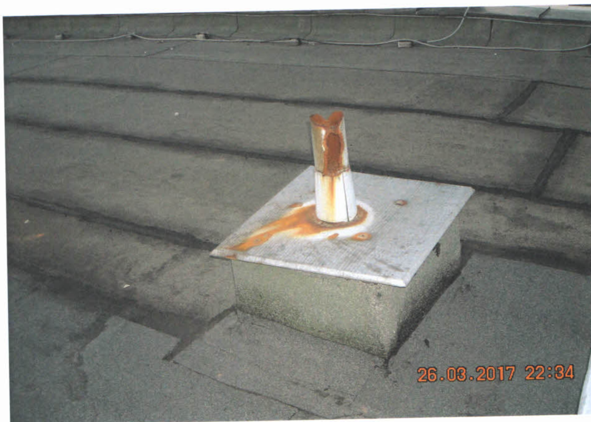
Detail ventilačnej hlavice – skorodovaná a nevhodný poklop