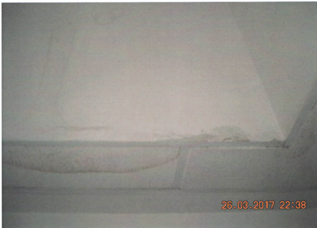
Zatekanie pod svetlíkom