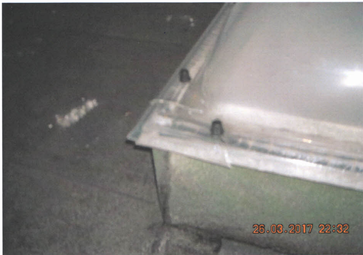
Detail poškodenia svetlíka – sú po životnosti a rozpadávajú sa