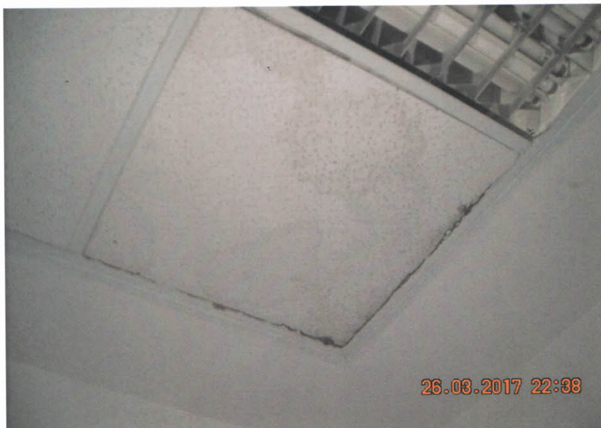
Zatečené chodby – poškodené kazety