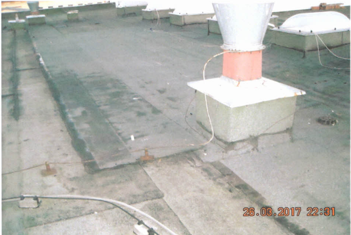
Prelepovanie poškodených miest