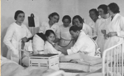
Dobrovoľné sestry ČK v nemocnici počas vyšetovania pacientky 1931

jatcami, budoval sieť sociálno-zdravotných staníc pre matky s deťmi, útulky pre osamelé matky, jasle, sirotince, detské letné prázdninové osady, školiť dobrovoľné ošetrovatelky ČK. Posielal chorých do ústavov a sanatórií, pomáhal pri živelných pohromách, rozvíjal zdravotnícku osvetu. Od roku 1921 sa v rámci Dorastu ČsČK všestranne staral o školskú mládež a učňov, od roku 1922 v spolupráci so Zemskou hasičskou jednotou na Slovensku školiť samaritánov, organizoval automobilové stanice prvej pomoci. V roku 1926 v spolupráci so Spolkom slovenských žien Živena otvoril v Martine Ústav Milana R. Štefánika, v ktorom pôsobila Škola pre sociálno-zdravotnú starostlivosť, z ktorej v roku 1932 vyšli prvé diplomované zdravotné sestry na Slovensku.