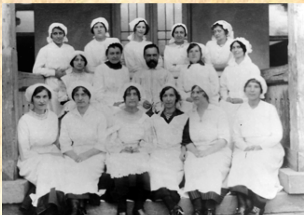
Dobrovoľné ošetrovatelky ČK v Turč. Sv. Martine počas 1. svet. vojny

Prvé stopy o činnosti Červeného kríža na území Slovenska vedú do roku 1881, kedy začala vyvíjať činnosť zemská pobočka Spoločnosti Červeného kríža krajín Svätej maďarskej koruny ako pomocná dobrovoľná organizácia vojenskej zdravotnej služby. V roku 1881 vznikli župné a mestské výbory a mestské obvody ČK v Banskej Bystrici, Banskej Štiavnici, Bratislave, Levcích, Liptovskom Hrádku, Liptovskom Mikuláši, Liptovskej Osade, Lučenci, Lubochni, Ružomberku, Skalici, Trebišove, Trnave, Zlatých Moravciach a Žiline. V nasledujúcich rokoch k nim pribudli ďalšie. Okrem sociálnej pomoci sa intenzívne zaoberali vytváraním všestranných podmienok na plnenie úloh pre prípad vojny. Bez ich všestrannej pomoci by počas 1. svetovej vojny nebola možná činnosť žiadneho zdravotníckeho zariadenia na území Slovenska.