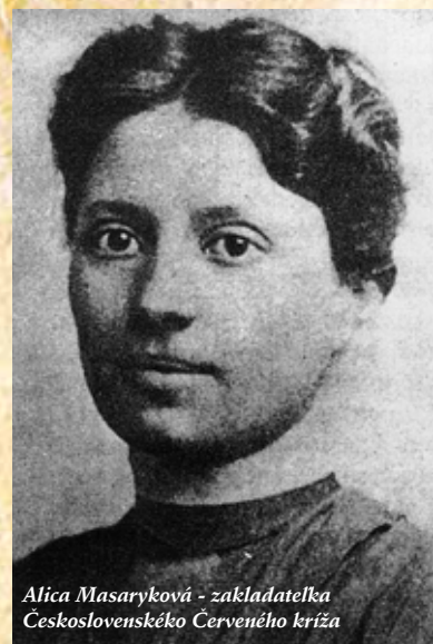
Alica Masaryková - zakladateľka Československého Červeného kríža

jatcami, budoval sieť sociálno-zdravotných staníc pre matky s deťmi, útulky pre osamelé matky, jasle, sirotince, detské letné prázdninové osady, školiť dobrovoľné ošetrovatelky ČK. Posielal chorých do ústavov a sanatórií, pomáhal pri živelných pohromách, rozvíjal zdravotnícku osvetu. Od roku 1921 sa v rámci Dorastu ČsČK všestranne staral o školskú mládež a učňov, od roku 1922 v spolupráci so Zemskou hasičskou jednotou na Slovensku školiť samaritánov, organizoval automobilové stanice prvej pomoci. V roku 1926 v spolupráci so Spolkom slovenských žien Živena otvoril v Martine Ústav Milana R. Štefánika, v ktorom pôsobila Škola pre sociálno-zdravotnú starostlivosť, z ktorej v roku 1932 vyšli prvé diplomované zdravotné sestry na Slovensku.