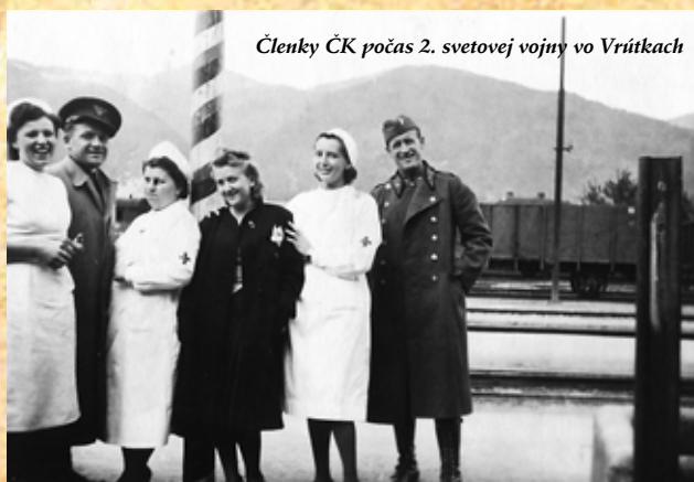
Členky ČK počas 2. svetovej vojny vo Vrútkach

utečencov z Protektorátu Čechy a Morava, z Poľska, väzňov z transportov a pochodov smrti, ošetrovali ranených a chorých, dodávali lieky, obvazový materiál, pomáhali v oblastiach postihnutých bombardovaním, darovali krv, pomáhali desiatkam evakuantov. Počas Slovenského národného povstania, po jeho potlačení a v časoch oslobodzovania republiky sa do činnosti a priamej pomoci raneným, chorým a zajatcom zapojili tisíce dobrovoľných i diplomovaných sestier ČK, samaritánov a samaritánok, sanitárov, lekárov, členov, funkcionárov i dobrovoľníkov ČK, desiatky z nich obeťovali svoje životy.