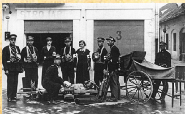
Členovia ČsČK a samaritáni v Banskej Bystrici okolo roku 1933

utečencov z Protektorátu Čechy a Morava, z Poľska, väzňov z transportov a pochodov smrti, ošetrovali ranených a chorých, dodávali lieky, obvazový materiál, pomáhali v oblastiach postihnutých bombardovaním, darovali krv, pomáhali desiatkam evakuantov. Počas Slovenského národného povstania, po jeho potlačení a v časoch oslobodzovania republiky sa do činnosti a priamej pomoci raneným, chorým a zajatcom zapojili tisíce dobrovoľných i diplomovaných sestier ČK, samaritánov a samaritánok, sanitárov, lekárov, členov, funkcionárov i dobrovoľníkov ČK, desiatky z nich obeťovali svoje životy.