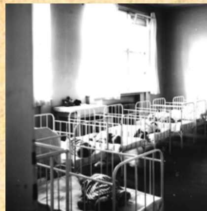
Detské jasle ČK v Turč. Sv. Martine

Po skončení 2. svetovej vojny sa v Československej republike obnovil ČsČK, ktorý aktívne pomáhal desiatkam tisícov repatriantov, odstraňoval hrozné následky vojny, zabezpečil materiálnu i zdravotnícku pomoc z celého sveta, pátraciú službu ČsČK zaplavili tisíce žiadostí pátrania po nezvestných. V Bratislave sa obnovila činnosť Divízie ČsČK na Slovensku, ČK nadviazal na rozsah i zameranie činnosti v duchu tradícií I. ČSR. Obnovil prípravu ošetrovateliek ČK, samaritánov, dopravnú zdravotnú službu, prevzal Školsko-zdravotnú službu vo všetkých školách na Slovensku, obnovil činnosť Dorastu ČsČK i tradíciu Mierových slávností ČsČK, z ktorých vznikol Svetový deň Červeného kríža (8. máj). Po roku 1949 prešiel majetok ČK do spoločnej pokladnice štátu.