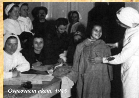
Ošacovacia akcia, 1945

V časoch hospodárskej krízy nahrádzal ČsČK svojou široko rozvinutou koncepciou činnosťou nedostatky štátnej správy, najmä v starostlivosti o deti, školskú mládež, chorých, starých a chudobných. Rozdával šatstvo, poriadal stravovacie akcie, zriaďoval sirotince, chudobince, stravovacie zariadenia pri školách, vybudoval Preventorium pre deti ohrozené tuberkulózou i sanatórium, spravoval niekoľko nemocníc, pomáhal tisícom vysťahovalcov. ČsČK poskytol pomoc i zahraničiu (v roku 1921 uskutočnil