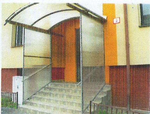
Detail vchodu č. 3