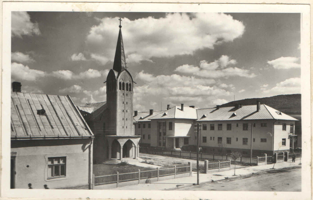
Будинок Середньої школи у Свиднику.