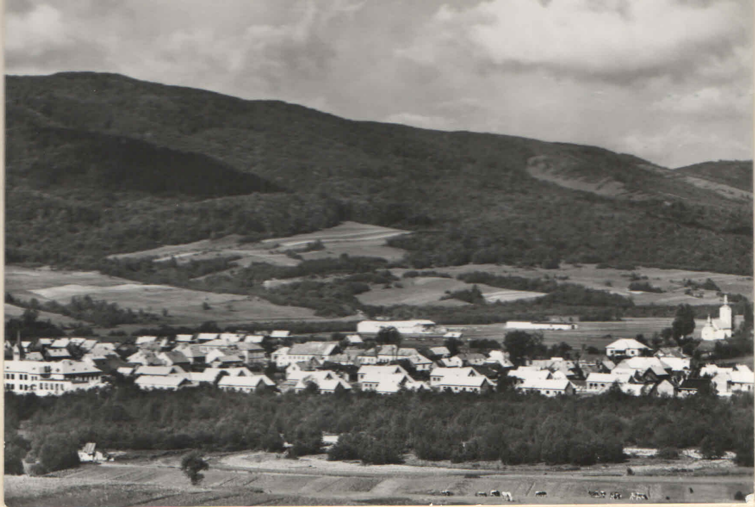
Вигляд Свідника у 1959 році.

В 1952-1954 р. у Свіднику були побудовані будинки: пошта, лісний завод, інтернат. В рамках державного будівництва протягом років 1951-1959 р. 160, а приватним порядком коло 80 квартир.